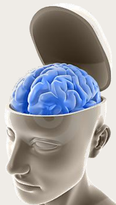
Cultura de Internacionalização